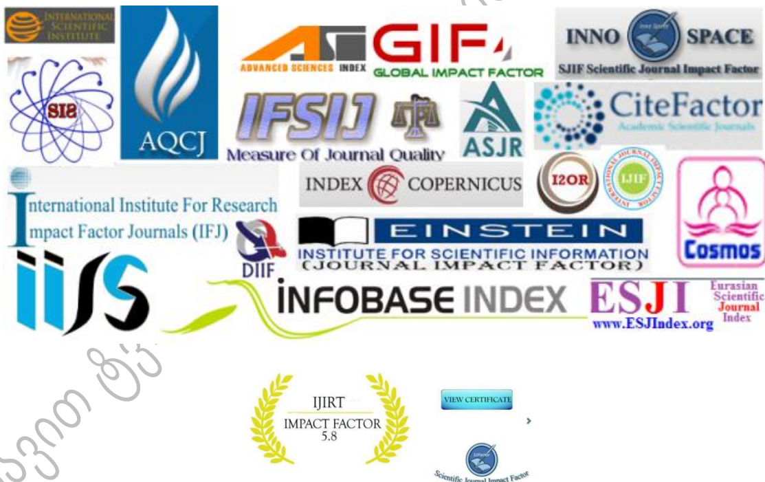
სურათი 3. ყალბი „Impact Factor“-ების და სხვა ჟურნალების შემფასებლები და რეიტინგები

ბუნებრივია ეს არ ნიშნავს რომ ჟურნალი რომელსაც აქვს ოფისი ლონდონში და სათაურში აქვს სიტყვა "International" აუცილებლად „მტაცებელია“. ამ ფაქტორების გადამოწმება აუცილებელია და თუ არის მსგავსება, ჯობია მოერიდოთ იქ გამოქვეყნებას.