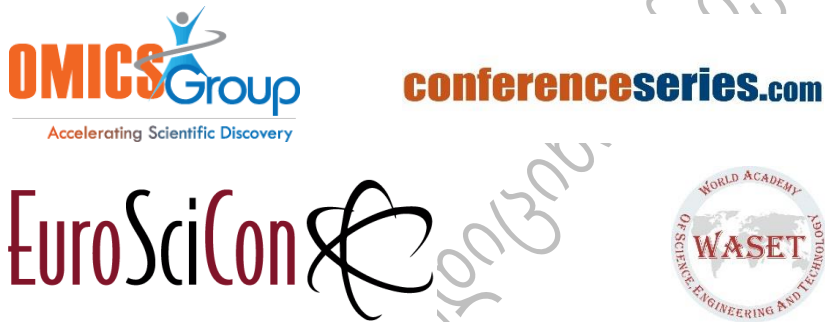
სურათი 5. რამოდენიმე აქტიური „მეტაცებელი“ კონფერენციების ორგანიზატორის ლოგო

შემდეგი სასარგებლო რესურსი შეიცავს ინფორმაციას „მეტაცებელი“ კონფერენციების და მათი „ორგანიზატორების“ შესახებ: https://libguides.caltech.edu/c.php?g=512665&p=3503029